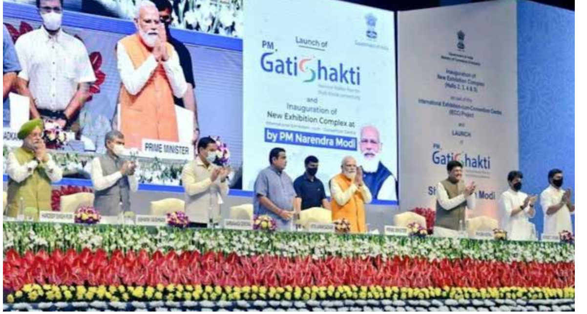
சக்தி நஷனல் மாஸ்டர் பிளான்' என்ற கட்டமைப்பு உதவும்.

எரிசக்தி உட்கட்டமைப்பைப் பொறுத்தவரை, பிரதமர் மோடி 2030 ஆம் ஆண்டுக்குள் 500 ஜிகாவாட் நிறுவப்பட்ட புதைபடிவ எரிபொருள் அடிப்படையிலான மின்சாரத் திறனை லட்சிய இலக்காக நிர்ணயித்து உலகளாவிய தலைமையை நிரூபித்துள்ளார். பணக்கார மண்டலத்திலிருந்து நுகர்வு மையங்களுக்கு மின்சாரத்தை வெளியேற்றும் பரிமாற்ற நெட்வொர்க், இந்த டிரான்ஸ்மின் திட்டங்கள், பாரம்பரியமாக உருவாக்க 3 - 4 ஆண்டுகள் ஆகும், திட்ட காலக்கெடுவை