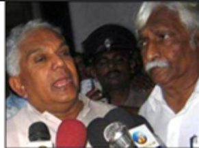
Ratwatties and their bodyguards were accused of killing opponents

The High Court in Sri Lanka has acquitted a former deputy defense minister on charges of murder ten Muslim youths.