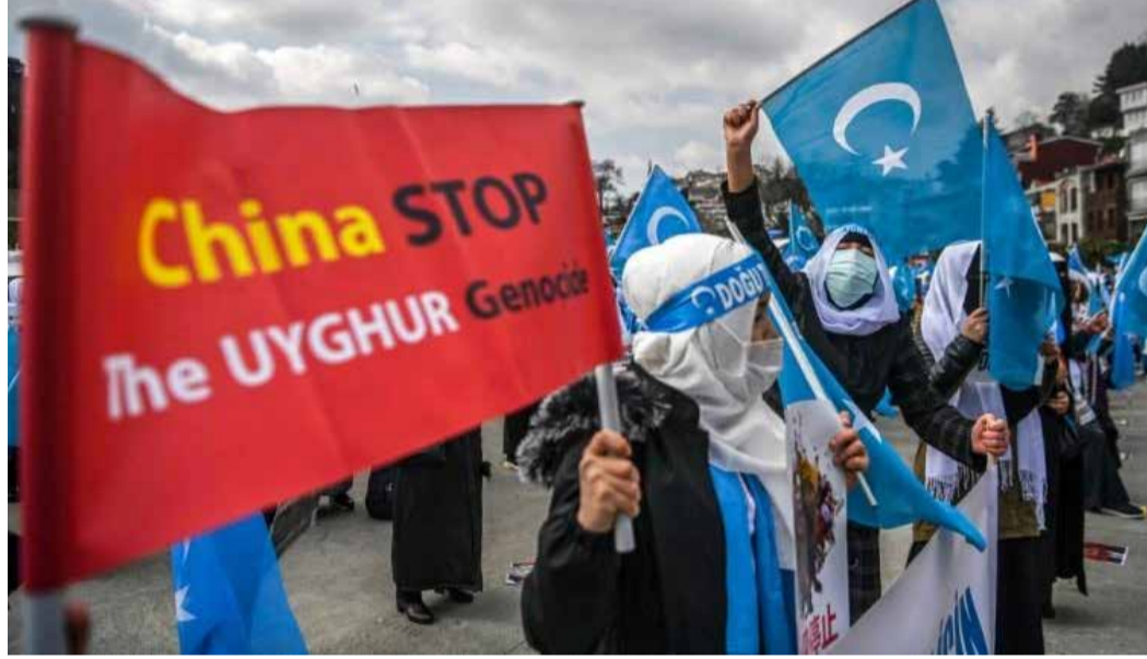
கட்டாயத்தில் உள்ளதாகவும், மறு கல்வி முகாம்களின் அடிப்படையில் புதிய தொழிற்சாலைகள் கட்டப்பட்டுள்ளன என்பதற்கான சான்றுகள் இருப்பதையும் கண்டறிந்துள்ளது.

சிஞ்சியாங்கில் உள்ள “தீவிரவாத எதிர்ப்பு மையங்களில்” சீனர்கள் ஒரு மில்லியன் மக்களை வைத்திருப்பதாக நம்பத்தகுந்த தகவல்கள் இருப்பதாக 2018 ஆம் ஆண்டில் ஐ.நா மனித உரிமைகள் குழு தெரிவித்துள்ளது. முகாம்களில் இருந்து தப்பிக்க முயற்சிக்கும் நபர்கள் உடல், மன மற்றும் பாலியல் சித்திரவதைகளை எதிர்கொண்டதாகவும், பெண்கள் கூட்டு கற்பழிப்பு மற்றும் பாலியல் துஷ்பிரயோகத்திற்கு ஆளானதாகவும் குற்றசாட்டுக்கள் பதிவாகியுள்ளன. டிசம்பர் 2020இல் நடந்த ஆய்வில் அரை மில்லியன் மக்கள் பருத்தி எடுக்க வேண்டிய