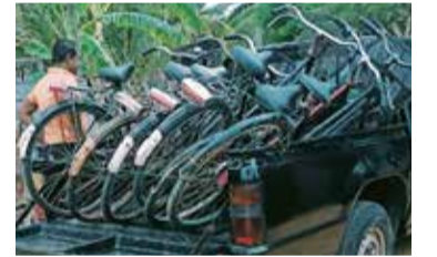
தாக பொலிஸார் கூறினர்.

யாழ்ப்பாணம், ஜூலை 17 யாழ்ப்பாணம் மாநகர பகுதிகளில் வண்டிகளைத் திருடி விற்பனை செய்த குற்றச்சாட்டில் ஒருவர் கைது செய்யப்பட்டுள்ளார்.