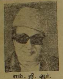
எம். ஜி. ஆர்.