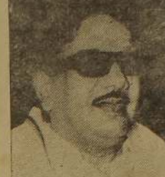
சுமங்க சனிமான் அனுவொற்றி சட்டி உன்னது

தமிழ் நாட்டில் கடந்த ரூயிற்றிக்கு முமை நடந்த நகராட்சி, பேரூராட்சி, ஊராட்சி மன்றத் தேர்தல்களில் வை விடகருதல் இடங்களில் கைப்பற்றி உள் ளது. தி. மு. க. நகராட்சி மன்றத் தேர்தலில் வெற்றி பெற்றது பெரிய சாதனை என்பதல்-தி. மு. க. வின் செல்வாக்கு அடிமட்டத்தில் இருந்த காலங்களில்கூட தி. மு. க. நகராட்சி மன்றத் தேர்தல்களில் கைப்பற்றி உள் ளது. தி. மு. க. வின் கோட்டையாக விளங்கி வந்தவை திராயப்பகுதி கள்தான். 15 வருடங்களின் பின்னர் சடந்தவாரம் நடந்த தேர்தல் முடிவுகள், இக் கோட்டை ஆட்டம் காணாததையே புலப்படுத்தினர்.