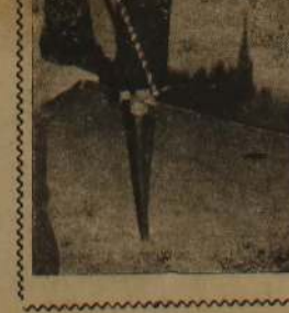
சுமார் 10 அடி உயர்ந்த உயர்ந்த மனிதர் கால் களில் கட்டைகளை கட்டியிருந்தார். (டி-9)

கொழும்பு, மே 3 நுவரெலியா, மாத்தறை, பதுளை ஆகிய பகுதிகளில் நேற்று ஒன்பது தீவிரவாதிகள் சரணடைந்ததாக அரசு செய்தியை ஏற்படுத்திக் கொடுப்பது சாத்தியம் எனத் தெரிவிக்கப்படுகிறது. (உ-9-3)