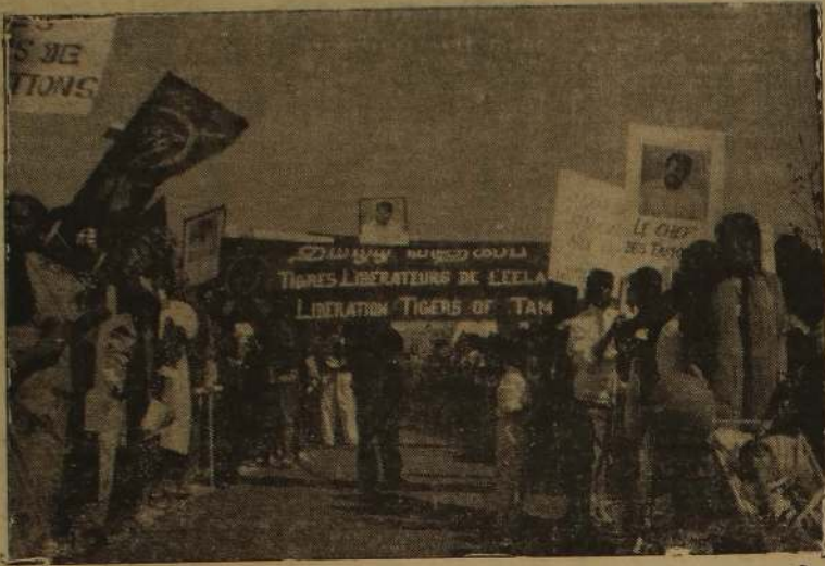
விடுதலைப்புலிகள் மக்கள் முன்னணி பிரான்சிஸ் பலம் மிக்க கொழிவாளர் அமைப்பின் தலைவரான பான சி. ஜி. டி. யுடன் இணைந்து நடத்திய மே தினப் போரணியின் போது எடுக்கப்பட்ட படம்.