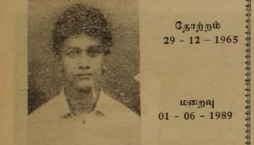
தோற்றம் 29 - 12 - 1965 மறைவு 01 - 06 - 1989