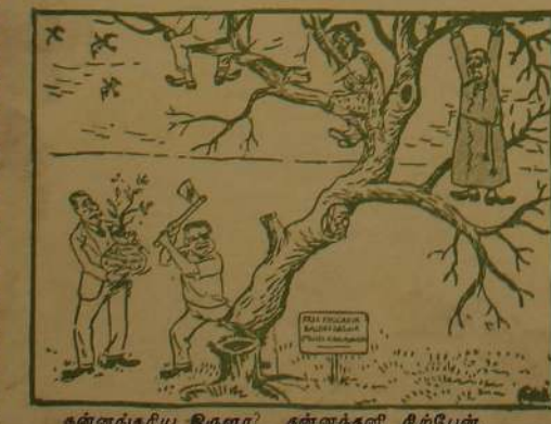
கன்னங்கரிய இருளா? தன்னத்தின் திற்பேன்.

திரு. அர்கல். ஜே. ட்ரெவலிடர் அமெரிக்க தூதரகத்தின் பிரசாரப் பகுதி அதிகாரி