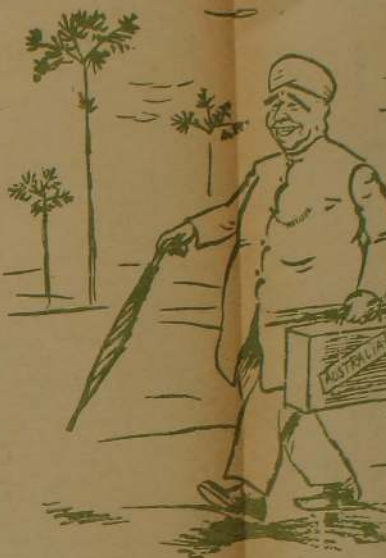
"HE COMES FROM JAFFNA"

பெற்றதாயும் பிறந்த பொன்னாடும் மற்றவர் தொண்டினும் மாண்புடைத்த