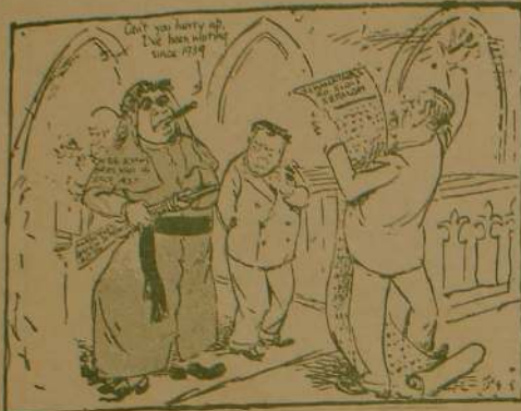
என்றும் எதற்கும் எங்கி திற்பாது தீன்றியர்ந்த கமைதாங்கி.