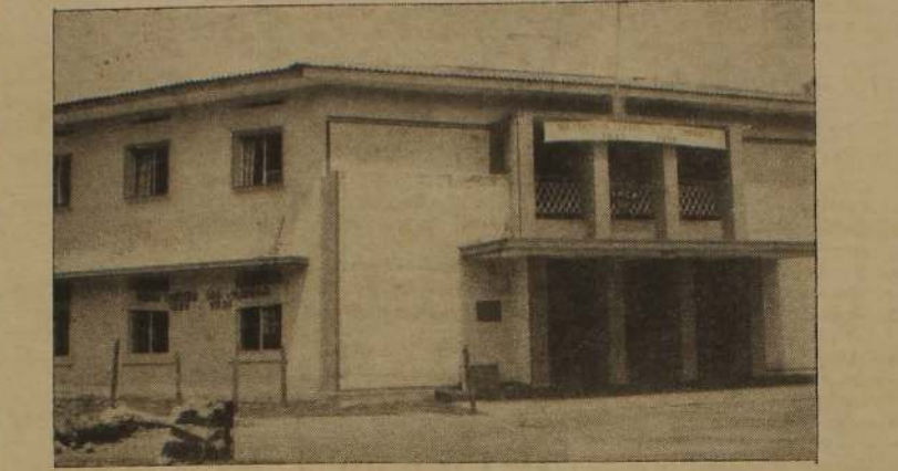
யாழ். வை. எம். சி. ஏ. கட்டடம்

தத்தின் முடிவையும் புதிய கட்டடத்தின் ஆரம்பத்தையும் குறிக்கும் இக்கட்டடத்திற்கான அடிக்கல் காலம் சென்ற பிரதமர் ஜெனரல் டி. எஸ். சேனாயக்காவின் நாட்டப்பட்டது. கட்டடம் கட்டி முடிவு பத்து வருடங்கள் சென்றன. இவ்விடைக் காலத்தில் அரவாசி முடிவுற்ற கட்டடத்தின் அங்கத்தினரின் இல்லங்களிலும் சங்கக் கூட்டங்கள் நடைபெற்றன. சங்கத்தின் பெயரிடும் கட்டடம் மொன்றில் கூட்டங்கள் நடத்தப்பட்ட வேண்டுமென்ற ஆவல் விரைவில் நிறைவேறியது. கட்டடம் முடிவு ரூபா 50,000/- மெல்திகாரச்செலவிடப்பட்டது. இம்மேலதிக செலவு வங்கிக்கடனாலும் தர்மமும் நம்பிக்கை நிதியத்தின் உதவியாலும் ஈடுசெய்யப்பட்டது. இக்கடனைக் கட்டி முடிக்க நடைபெறும் செயற்கள்