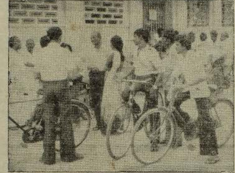
யாழ்ப்பாணத்தில் உள்ள மக்கள் வங்கிக் கிளை களின் முன்னால் மறியல் போராட்டம் நேற்று ஆரம்பமானது.

யாழ்ப்பாணம், மார்ச் 18 யுத்த நிறுத்தக் கண்காணிப்புக் குழு விடுத்த அழைப்பை யாழ்ப்பாணம் பிரசைகள் குழு நிராகரித்து விட்டது. ஜனவரி 4, 5-ஆம் திகதிகளில் யாழ்ப்பாணம் நடந்த சம்பவங்களைப் பற்றி கொழும்பில் நடத்தப்படும் விசா ரணையில் கலந்துகொள்ளும்படி விடுத்த அழைப்பை நிராகரிக்கப்பட்டுள்ளது. கண்காணிப்புக் குழு வினாக்க விரும்பவில்லை முன் வந்து சாட்சியம் அபயடி சாட்சியம் அளிப்பவர் களுக்கு பாதுகாப்பு வழங்க ப்படும். கொழும்புக்கு வாருங்கள்-இப்படி யுத்த நிறுத்தக் கண்காணிப்புக் குழு மூன்று தடவைகள் உட்பிரசைகள் குழு வுக்கு அழைப்புக்கு மேல் அழைப்பு விடுத்தது. இந்த அழைப்புக்களை நிராகரித்து யாழ்ப்பாணம் பிரசைகள் குழு, கண் காணிப்புக் குழுவுக்கு (4 ஆம் பக்கம் பார்க்க)