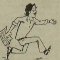
அட, அட! யுத்த நிறுத்தக் கண்காணிப்புக் குழு இன்னமும் இருக் குதி! நான் அதுகின்றரை கதை யே முடிவுக்கு என் டெ. கோலா நினைக்கக் கொண்டிருக்கிறேன்.

செவ்வாய், மார்ச் 17 இலங்கை அமைச்சர் அத்துலத் முதலியின் போர்நிறுத்தத் திட்டம் ஓர் ஏமாற்று நடவ டிக்கை இதனை நம்பா மல் இத்தியராணுவத்தை இலங்கைக்கு அனுப்பி தமிழ் மக்களை அறிவிச் செய்தது. இருந்து காப்பாற்ற வேண்டும். இப்படி தமிழ்நாடு சாந்தி காமராஜ் காங்கி ரஸ் தலைவர் குமரி அனந் தன் சொர்க்குர்.