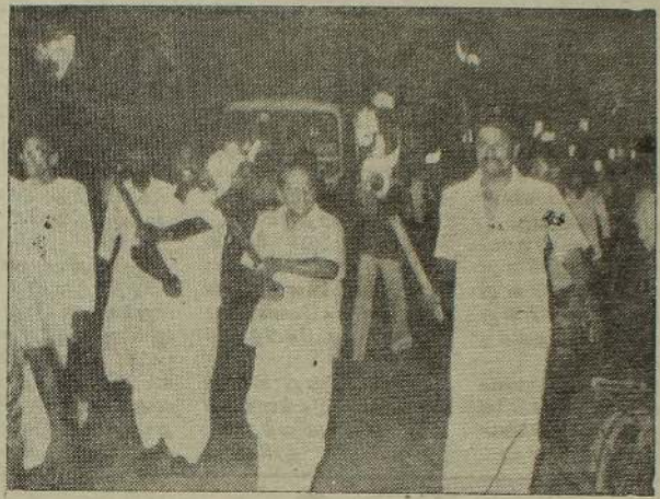
அக்கினிக் குஞ்சொன்று கண்டேன் - அதை அங்கொரு காட்டிலோர் போந்திடலை வைத்தேன்; வெந்து தணிந்தது காடு - தழல் வீரத்தில் குஞ்சென்றும் மூப்பென்றும் உண்டோ? - மகாவி பாரதியார் - சிறு தனலும் வீரம் மிக்கது வீரத்திற்கு குஞ்சென்றும் மூப்பென்றும் கிடையாது என்கிறார் பாரதியார். சிறு தனலாய் மூட்டப்படுவது பெரும் காட்டையே எரித்து நாசமாக்கி விடுகிறது. அநீதியைச் சுட்டெரிக்கும் வீரச் சுடராக அக்கினியைக் கொள்வர். அது சம்மாரத்தைக் குறிப்பது. சுழத்திலை தமிழர் மீது கட்டவிழ்த்து விடப்பட்டிருக்கும் அநீதிகளுக்கு எதிராக சுடந்த வியாழன் அறு தி மூட்டப்பட்டது யாழ்நகரில் முதத்தடவையாக நடத்தப்பட்ட தீவட்டிய ரோணியின்போது எடுக்கப்பட்ட படத்தை மேலே காண்கிறீர்கள்.