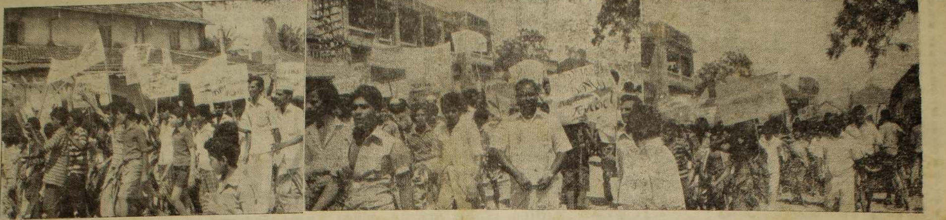
விபியாவில் அமெரிக்கா நடத்திய தாக்குதல்கள் கண்டித்து யாழ்ப்பாணத்தில் நேற்று நடத்தப்பட்ட பேரணியின் போது எடுக்கப்பட்ட படங்கள்.

சுடர்: - 1 யாழ்ப்பாணம் அசுசுய ஸ்ரீ சித்திரை மீ 5 உ வெள்ளிக்கிழமை ஹிஸ்ட்ரி 1406 ஷஃபா பிறை 8 (18 04-1986) UTHAYAN A LIVERY TAMIL DAILY கதிர்:129