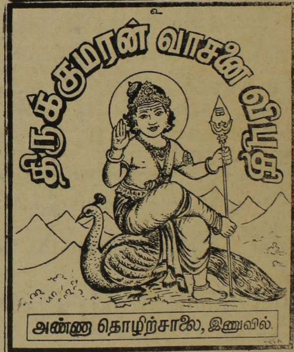
கோயில் தேவைகளுக்கும், நாளாந்த பாவனைக்குமான விபூதி தொகையாகவும், சிலலறைகளாகவும் பெற்றுக்கொள்ளலாம்.

தேரீளில் வருவாய் கந்தா! தேரீளில் வந்தே நாட்டின் தென் திசைப் பகைமை நீக்கி ஊரீளில் வாழும் மக்கள் உறுதுயர் எல்லாம் தாங்கி பாரிளில் அமைதி காத்தே பருவரல் யாவும் தீர்த்து சிரிளில் குறையா தெங்கும் சிறப்புடன் தருவாய் சரணம். தெருவில் நின்றே நாங்கள் தேரீளில் பவனி செல்லும் உருவில் பெரிய உன்றன் உள்ளொளி காண்போம் ஐயா! கருவில் பிறவா வண்ணம் காத்தருள் புரியும் ஸ்வாமி அருவில் உருவாய் நிற்கும் அறுமுகப் பொருளே சரணம் — சிங்கையாழியான் —