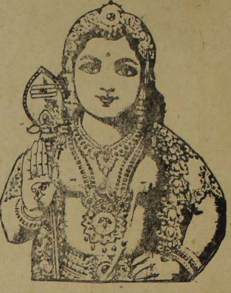
நீளமான காலத்தின் எல்லையுள் வாழ்ந்தவர்கள் எங்கள் கந்தன் எங்கள் முருகன் என்று தங்களில் ஒருவனாகவே கொள்ளுமளவுக்கு எல்லோர் வாழ்வினும் பின்னிப் பிணைந்தவன் நல்லூர்க் கந்தன்.

இன்று நேற்றல்லசை பகப் பெருமான் என்று சொல்லப்பட்ட றி சங்கபோதிபுவனேசபாகு பதினெந்தாம் நூற்றாண்டின் நடுப்பகுதியிலே நல்லூர்க் கந்தன் சுவாமி கோவிலைக் கட்டுவித்தான் என்பது சரித்திர உண்மை. கடந்த ஐந்துநூறு வருடங்களாகக் கோட்டானு கோடி மக்களிடையிலே வற்றாத முற்றாத அணி நலவ் கொண்டு திகழ்கின்றான் நல்லூர்க் பெருமான்.