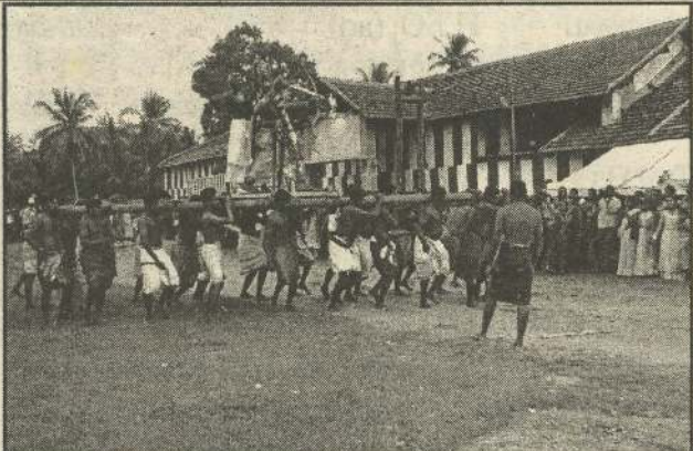
ஒட்டுசுட்டான் தான்தோன்றல்வரர் ஆலயத்தில் சூரம்போர் நிகழ்வு சிறப்பாக நடைபெற்றதைப் படத்தில் காணலாம்.

இந்த நிலையில் குறித்த கடற்படைத்தளத்துக்கு நிரந்தரமாக காணி சுவீகரிப்பு நடைபெற பலமுறை அளவீட்டுப் பணிகள் முன்னெடுக்கப்பட்டிருந்த நிலையில் மக்கள் தொடர் போராட்டங்களை முன்னெடுத்து வருகின்றமை குறிப்பிடத்தக்கது. (2-281)