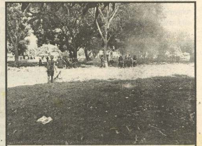
முல்லைத்தீவு மாவட்ட வைத்தியசாலை வளாகத்தில் சிரமதானப் பணி முன்னெடுக்கப்பட்டுள்ளது. பல்வேறு தொற்று நோய்கள் பரவி வரும் நிலையில் முல்லைத்தீவு இளைஞர் படையணியினால் நேற்று முன்தினம் காலை 9 மணிமுதல் நண்பகல் வரை சிரமதானப் பணி நடைபெற்றுள்ளது. இதில் சுமார் நூறு இளைஞர், யுவதிகள் கலந்து கொண்டு வைத்தியசாலை வளாகத்தை சுத்தம் செய்துள்ளனர்.

இதன்போது புதிய அரசியல் யாப்பு நாட்டின் வரவு-செலவுத்திட்டம் தொடர்பாக மக்களிடையே போதியளவு விழிப்புணர்வு காணப்படாமல் தொடர்பான விடயங்கள் கலந்துரையாடப்பட்டன. (2-250)