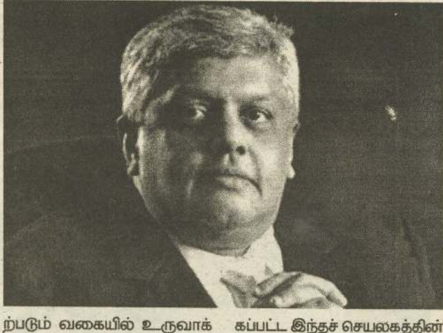
ற்படும் வகையில் உருவாக்கப்பட்ட இந்தச் செயலகத்தின்

(கொழும்பு) நல்லிணக்கப் பொறிமுறைகளை ஒருங்கிணைப்பதற்கான செயலகத்தின் பணிக்காலம் ஒன்றரை ஆண்டுகளுக்கு நீடிக்கப்பட்டுள்ளது. நல்லிணக்கம் தொடர்பான பணிகளை முன்னெடுப்பதற்காக மனோ தித்தவெலை வைத்தலைவராகக் கொண்ட இந்தச் செயலகம் 2015ஆம் ஆண்டு உருவாக்கப்பட்டது. இரண்டு ஆண்டுகள் செய