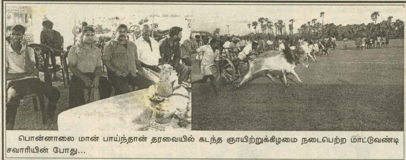
பொன்னாலை மான் பாய்ந்தான் தரவையில் கடந்த ஞாயிற்றுக்கிழமை நடைபெற்ற மாட்டுவண்டி சவாரியின் போது...

ஜனாதிபதியின் மத்திய கிழக்கு பிராந்தியத்திற்கான முதலாவது அரசு துறை விஜயமாக கட்டார் நாட்டிற்கு வருகை தந்ததையிட்டு அங்கு வாழும் இலங்கையர்கள் தமது மகிழ்ச்சியை வெளிப்படுத்தினர். (இ-7)