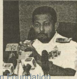
யினால் ஓய்வுபெறவேண்டிய நிலை ஏற்பட்டுள்ளது. (இ-7)