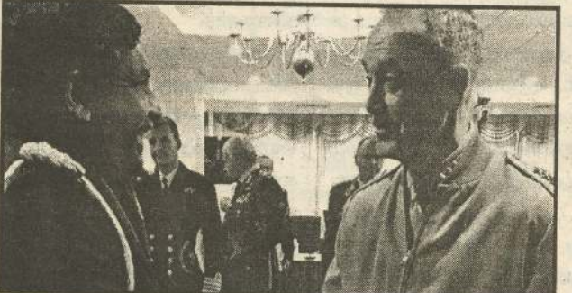
(கொழும்பு) உலகளாவிய ரீதியில் தீவிரவாதிகளின் தாக்குதல்களை ஒடுக்குவது பற்றிய

கலந்து கொண்டார். எழுபதுக்கும் அதிகமான நாடுகளின் பாதுகாப்புத் தலைவர்கள் கலந்துகொண்ட இரண்டாவது சர்வதேச மாநாடு அமெரிக்காவின் வேர்ஜீனியாவில் கடந்த 23ஆம், 24ஆம் திகதிகளில் நடைபெற்றது. இதன் போது தீவிரவாத நடவடிக்கைகளை ஒடுக்குவதற்காக நாடுகளிடையே ஏற்படுத்தப்படவேண்டிய தொடர்புடல் மற்றும் பரஸ்பர உதவிகளை குறித்து கலந்துரையாடப்பட்டன. (இ-7)