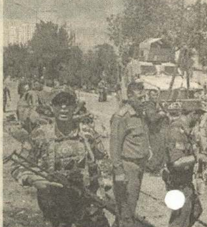
ஆப்கானிஸ்தான் நாட்டின் மேற்கு பகுதியில் உள்ள பரா மாகாணத்திற்குட்பட்ட புஷ்ட் ரோடு மாவட்டத்தில் உள்ள இராணுவ சோதனை சாவடியின் மீது நேற்று முன்தினம் இரவு வெடி குண்டுகளை வீசியும், துப்பாக்கிகளால் சுட்டும் தலிபான் தீவிரவாதிகள்.

(காபூல்) ஆப்கானிஸ்தான் நாட்டின் மேற்கு பகுதியில் உள்ள இராணுவ சாவடி மீது தலிபான் தீவிரவாதிகள் நடத்திய தாக்குதலில் 9 வீரர்கள் பலியாகினர். தாக்குதல் நடத்திய 17 தீவிரவாதிகள் கொல்லப்பட்டனர்.