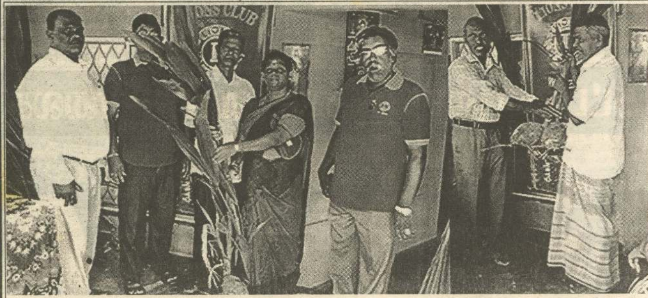
யாழ்ப்பாணம், நுழைவாயில் யென்ஸ் கழகம் தென்னைப் பயிர்ச்செய்கையை ஊக்குவிக்கும் நோக்குடன் ஒவ்வொரு பிரதேசங்களிலும் பயனாளிகளை தெரிவு செய்து நல்லினத் தென்னங்கன்றுகளை வழங்கி வருகின்றது. இதன் அடிப்படையில் பருத்தித்துறை வீதியில் வேம்படிச் சந்திக்கு அருகாமையில் உள்ள சங்க செயலாளருடைய இல்லத்தில் வைத்து 50 பயனாளிகளுக்கு தென்னை பயிர்ச்செய்கை உத்தியோகத்தரின் அறிவுறுத்தலுடன் யென்ஸ் கழகத் தலைவர் மற்றும் உறுப்பினர்களால் தென்னங்கன்றுகள் வழங்கி வைக்கப்பட்டன.

ஸ்ரீலங்கா சுதந்திர கட்சியின் அடுத்தகட்ட நடவடிக்கை குறித்து கருத்து தெரிவிக்கும் போதே இவ்வாறு தெரிவித்தார். (இ-7)