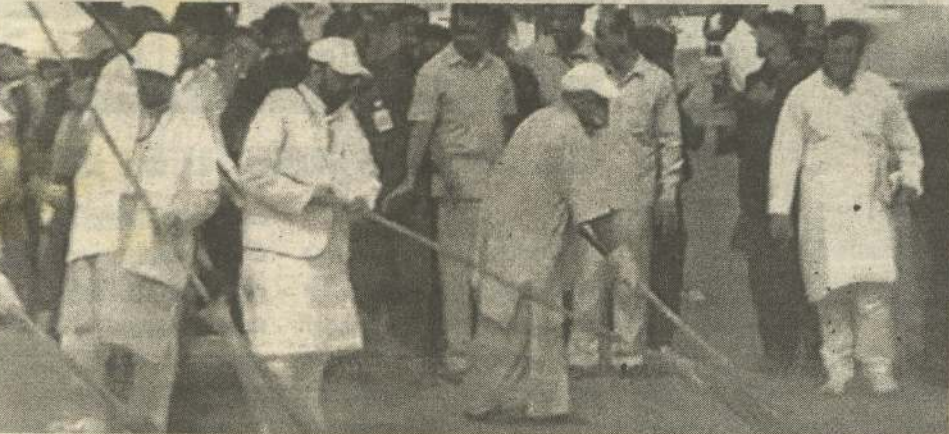
(ஆக்ரா) பிரதமர் மோடியின் முக்கிய திட்டங்களில் ஒன்றான தாய்மை இந்தியாவை துரிதப்படுத்தும் நோக்கில், ஆக்ராவில் உள்ள உலகப் புகழ் பெற்ற தாஜ்மஹாலை உத்தரப்பிரதேச மாநில முதல்வர் நேற்று தாய்மை செய்யும் பணியில் ஈடுபட்டார். முதல்வரையோகி ஆதித்ய நாத் நேற்றுக் காலை தாஜ்மஹால் வளாகத்திற்கு சென்றார். அங்கு சென்ற அவர் கையில் துடைப்பம் ஏந்தி தாஜ்மஹால் வளாகத்தை தாய்மைப்படுத்தினார். யோகி ஆதித்யநாத் துடன் அரசு அதிகாரிகள் மற்றும் அமைச்சர்களும் தாஜ்மஹாலை தாய்மை செய்யும் பணியில் ஈடுபட்டனர். முதல்வரின் வருகையை முன்னிட்டு அங்கு பலத்த பாதுகாப்பு போடப்பட்டிருந்தது.

அதனை தொடர்ந்து முதல்வர் யோகி ஆதித்ய நாத் ஷாஜகான் பூங்கா பகுதியிலும் தாய்மை பணியில் ஈடுபட்டார். முன்னதாக உத்தரப்பிரதேச அரசின் சுற்றுலா வழிகாட்டி பக்கத்திலிருந்து தாஜ்மஹால் அகற்றப்பட்டது. இது நாடு முழுவதும் பெரும் சர்ச்சையை ஏற்படுத்தியது. அதனை தொடர்ந்து பல்வேறு பாரதிய ஜனதா தலைவர்கள் தாஜ்மஹாலுக்கு எதிரான பல கருத்துக்களை முன் வைத்ததால் பெரும் சர்ச்சை வெடித்தது. இந்நிலையில் அம்மாநில முதல்வர் யோகி ஆதித்ய நாத் தாஜ்மஹாலை தாய்மைப்படுத்தும் பணியில் ஈடுபட்டமை குறிப்பிடத்தக்கது. (8)