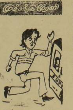
ஓம் ஓம், உவை செய்ய மாட்டோம், செய்ய மாட்டோம் என்று சொல்லித்தானே ஆக்க னைக் கொல்லுகிறோம்...! உதுக்கை நம்ப நாங்கள் என்ன மடையே?

விலை ரூபா 3-00 மட்டுமே (4-ம் பக்கம் பார்க்க)