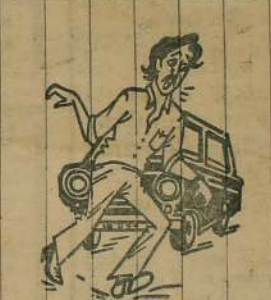
உலையில யார் உருத்திரா கப்பி பூனையோ.....