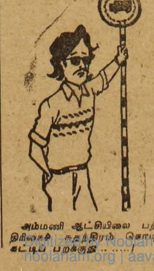
அம்மணி ஆட்சியிலே பத்திரிகைச் சுதந்திரம் நோயடிக்கப்பட்டிருக்கிறது.