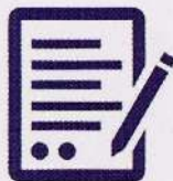
Opposite Account Information Form

கணக்கொன்றினை ஆரம்பிப்பதற்கு அவசியமான தகவல்கள் மற்றும் பங்கு வர்த்தகம் செய்வதற்கான கொள்வனவு விற்பனை கட்டளைகளை உரிமம் அளிக்கப்பட்ட பங்குத்தரர்கள் அல்லது முதலீட்டு ஆலோசகர்களுக்கு சமர்ப்பித்தல்.