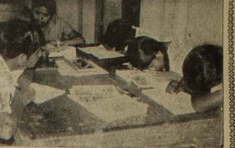
பார்வையை முற்றாக இழக்காத மாணவர்கள் பூக்கடைகளின் உதவியுடன் உற்றுப் பார்த்து எழுதும் காட்சி.

மக்களும் அவர்களது சைகை மொழியை அவசியம் அறிந்திருக்க வேண்டும். சைகை மொழி அவர்களிடம் பொதுமக்களால் இலகுவில் பயிலக்கூடிய இலகுவான மொழி மோழியைப் பயில்கிறார்கள்.