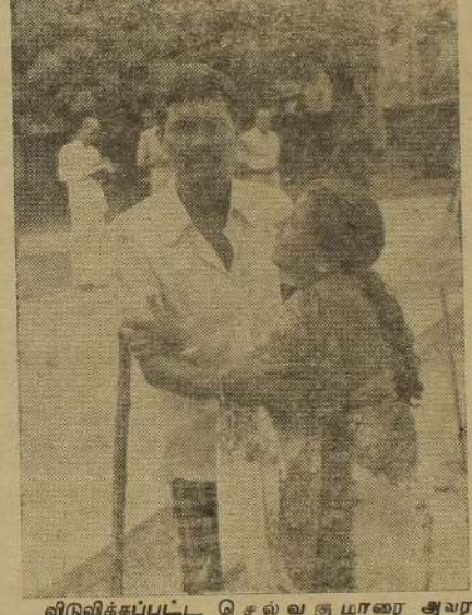
விடுவிக்கப்பட்ட செல்வகுமாரை அவரது தாயார் சட்டியுணைத்து கண்ணீர் மலிகவரவேற்கும் காட்சி.

வங்கி ஊழியர் 9 பேர் திருமலையில் கைது திருகோணமலை, டிச. 20 திருகோணமலையில் பணியாற்றும் இலங்கை வங்கி ஊழியர்களில் 9 பேர் இதுவரை மொத்தம் ஒன்பது தீவிரவாத இயக்கங்களால் தொடர்பு புடையவர்கள் என்ற சந்தேகத்தின் பேரில் கைது செய்யப்பட்டு பூலா தடுப்பு முகாமில் காவலில் வைக்கப்பட்டுள்ளனர். இதுதொடர்ந்து பேரில் இரண்டு பேர் பெண் ஊழியர்கள். (உ-எ-150)