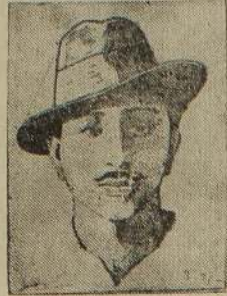
பஞ்சாப்பின் இளங்கதிர்... பஞ்சாப்பின் இளங்கதிர்...