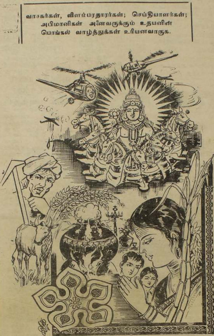
வாசகர்கள், விளம்பரதாரர்கள்; செய்தியாளர்கள்; அபிமானிகள் அனைவருக்கும் உதயனின் பொங்கல் வாழ்த்துக்கள் உரியனவாகுக.

யாழ்ப்பாணம், ஜன. 14 தை பிறந்தால் வழி பிறக்கும் என்பது தமிழர்களின் நம்பிக்கை. இந்த நல்லாண்டு நிறைவேற்றம் உறுதிப்படுத்திக் கொள்ள நாம் எடுத்த செயற்படுத்த தீவிரமாக முயற்சிப்பது எதிர்காலத்திற்கு பெரும் பயன் தருவதாக அமைகிறது. (இ)