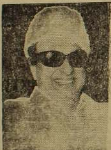
எம். ஜி. ஆர்.

தனித்தனி சந்திப்பு இதேவேளை ஐந்து தமிழ்ப்போராளி அமைப்புக்களின் தலைவர்களும்