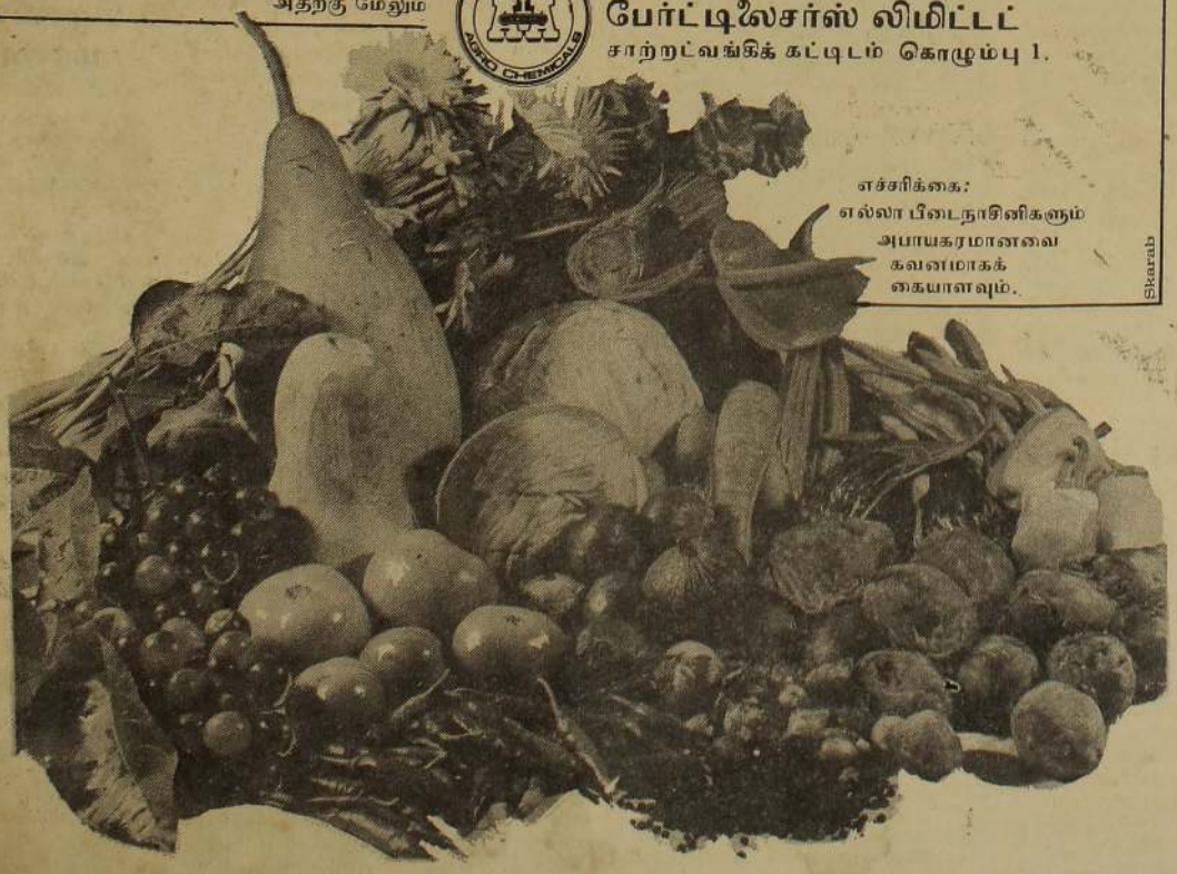
எச்சரிக்கை: எல்லா பிடைநாசினிகளும் அபாயகரமானவை கவனமாகக் கையாளவும்.

அங்லோ-ஏஷியன் பேர்ட்டிஸைர்ஸ் லிமிட்டட் சாற்றல்வங்கிக் கட்டிடம் கொழும்பு 1.