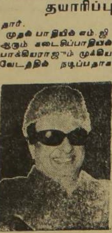
படம் அமைப்போடு மி.ஜி.ஆர். இவ்வாறு எடுக்கப்பட்ட ஒரு படத்தின் எம்.ஜி.ஆர். படப்பிடிப்பின் போது