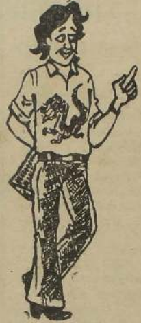
இந்த நேரத்துக்குச் ஷேல் அடிப்போய் என்ற ஒவ்வொரு நாளுக்கு ரெலி போலை பண்ணிச் சொக் லுநினமாம் அப்ப நக ரத்தினுள் எப்பிடி மக்க ளைக் காணுகிறது!

இந்தியாவின் தலையீடு உடனடியாகத் தேவை பிரசைகள் குழு அறிக்கை யாழ்ப்பாணம், மார்ச் 10