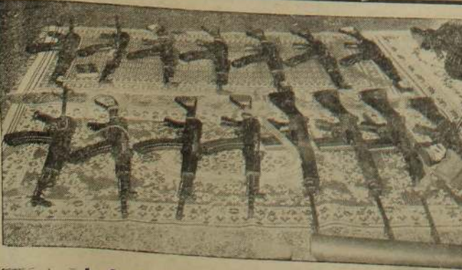
புலிகள் கைற்றிய ஆயுதங்களில் ஒருகுதி

சேருவில் தேர்தல் தொகுதியிலுள்ள சேருநுவர கிராமத்தில் நேற்று அதிகாலை நடத்தப்பட்ட தாக்குதல் ஒன்றில் 26 சிங்களவர் கொல்லப்பட்டனர். இவர்களில் பெரும்பாலானோர் ஊர்காவல் படைமீனரால் கொல்லப்பட்டனர். இத்தாக்குதல் நடத்தியவர்களைப் பிடிப்பதற்காக ஆயுதப் படைகள் அப்பகுதியைச் சுற்றி வளைத்துத் தேடுதல் நடத்துகின்றன என்றும் வெகுஜனத் தொடர்பு நிலையம் தெரிவித்தது. (இ-எ)