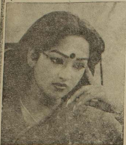
சொகையேதான அவரும் அதற்கு சம்மதம் தெரிவித்த விட்டார்.

அந்த நீண்ட நாள் அந்தப் படத்தில் ஆசையை அவரிடம் நடத்தமுடிந்ததும் பூர்ண