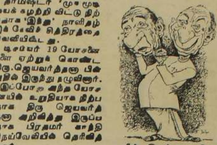
இவ்வாறு... தட்சர்... தட்சர்... தட்சர்...