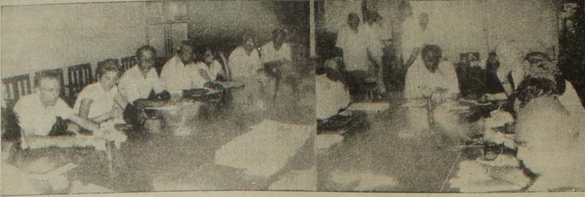
யாழ்ப்பாணத்துக்கு விஜயம் செய்வதே நோர்வே நாட்டு உயரதிகாரிகள் யாழ். செயலகத்தில் அரச அதிபருடன்

முதல் ஏற்பட்ட இரண்டாம் கட்ட அசம்பாவிதத்தைத் தொடர்ந்து இச்சந்தையும் மூடப்பட்டது. இதனைத் தொடர்ந்து பரந்தன் சந்தை இயங்கி வந்தது. பின்னர் பரந்தனில் கடந்த பெப்ரவரி இரண்டாம் அசம்பாவிதத்தில் இச்சந்தையும் செயலிழந்தது. கட்டடமும் உடைக்கப்பட்டது. வடக்கு, கிழக்கு மாகாணங்களில் புனர்வாழ்வு வேலைகள் ஆரம்பிக்கும் பட்சத்தில் கிளிநொச்சியில் தரைமட்டமான பழைய சந்தை இருந்த இடத்தில் நவீன சந்தையும் அதற்கு முன்பாகப் பஸ் நிலையமும் அமைக்கத் திட்டமிடப்பட்டுள்ளது என மேலும் தெரிவிக்கப் படுகிறது.