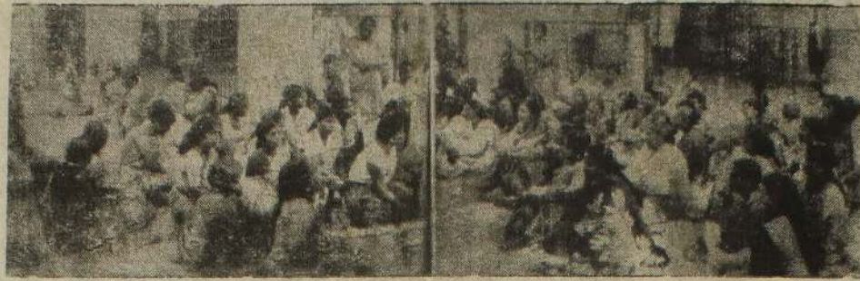
யாழ்ப்பாணம் முன்னணியினர் நேற்று கைலாச பிள்ளையார் கோவில் முன்றலில் அடையாள உண்ணாவிரதம் மேற்கொண்டிருந்தவர்களை எடுக்கப்பட்ட படங்கள் மேலே காணலாம்.

யாழ்ப்பாணம், மார்ச் 6 பாடசாலைகளுக்குச் செல்லும் வேளை வில் மாணவர்கள் இந்திய அமைதிப் படையினர் தடுத்து வைக்கப்பட்ட மாட்டார்கள். இவ்வாறு இந்திய அமைதிப் படையினர் உயர் அதிகாரி ஒருவர் நேற்று நடந்த உண்ணா விரதத்தின் போது இடம்பெற்ற கலந்தாரை யாடலின் போது அண்மையர் முன்னணி யினரிடம் தெரிவித்தார். இது அறிந்து அண்மையர் முன்னணியைச் சேர்ந்த ஒருவர் உள்வி எழுப்பிய பொழுதே அவர் இவ்வாறு தெரி வித்தார். பாடசாலை நேரம் களில் இந்திய அமைதிப் படையினர் விடச் சோதனை வில் ஈடுபட்டாலும் இடைத் தேர்தல் ஒத்திவைப்பு கொழும்பு, மார்ச் 6 ஹோமம் நாடாளுமன்றத் தொகுதியை இடைத் தேர்தல் கால வரையறையின்படி ஒத்தி வைக்கப்பட்டது. இது சம்பந்தமாக ஜனாதிபதி ஜெயவர்தன ஜனாதிபதி வர்த்தமாளி அறிவித்தல் ஒன்றை நேற்று எடுத்தார். இந்த இடைத்தேர்தல் இம்மாதம் 21ஆம் திகதி நடைபெறுவதாக இருந்தது. (ஒ-ஏ)