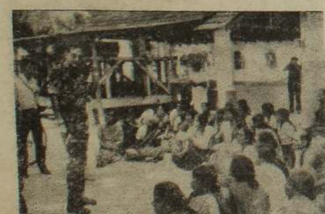
உண்ணாவிரதம் மேற்கொண்டிருந்த அண்மையரிடம் அமைதிப்படையினர் ஒருவர் உரையாடுவதைப் பதிவு செய்த காளவாழ்வு.

06 - 03 - 1988 மாகி 23 ருயிற்றுக்கிழமை சுபநேரம்: 9. 25 முதல் 10. 55 வரை ராகுசாலம்: 4. 55 முதல் 6. 25 வரை இவை பகலுக்கும் இரவுக்கும் பொருந்தும்.