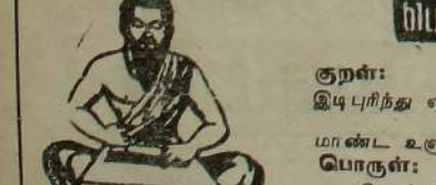
குறள்: இடிபுரிந்து எள்ளுஞ்சொல் கேட்பர் மடிபுரிந்து மாண்ட உருற்றி வவர். பொருள்: சோம்பலும் விருமும் மேற்கொண்டு சிறந்த முயற்சி இல்லாதவராய் வாழ்கின்றவர், பிறர் இடித்துக்கொள்புரிந்துகொள்ளும் சோம்பலும் விருமும் அடைவர்.

★ இந்நோயின் மலம் தளத்தன்மை வாய்ந்தது. அரிசிக் குருதித் தண்ணீர் என்று பொதுவாகக் கூறுவது பொருத்தமல்ல.