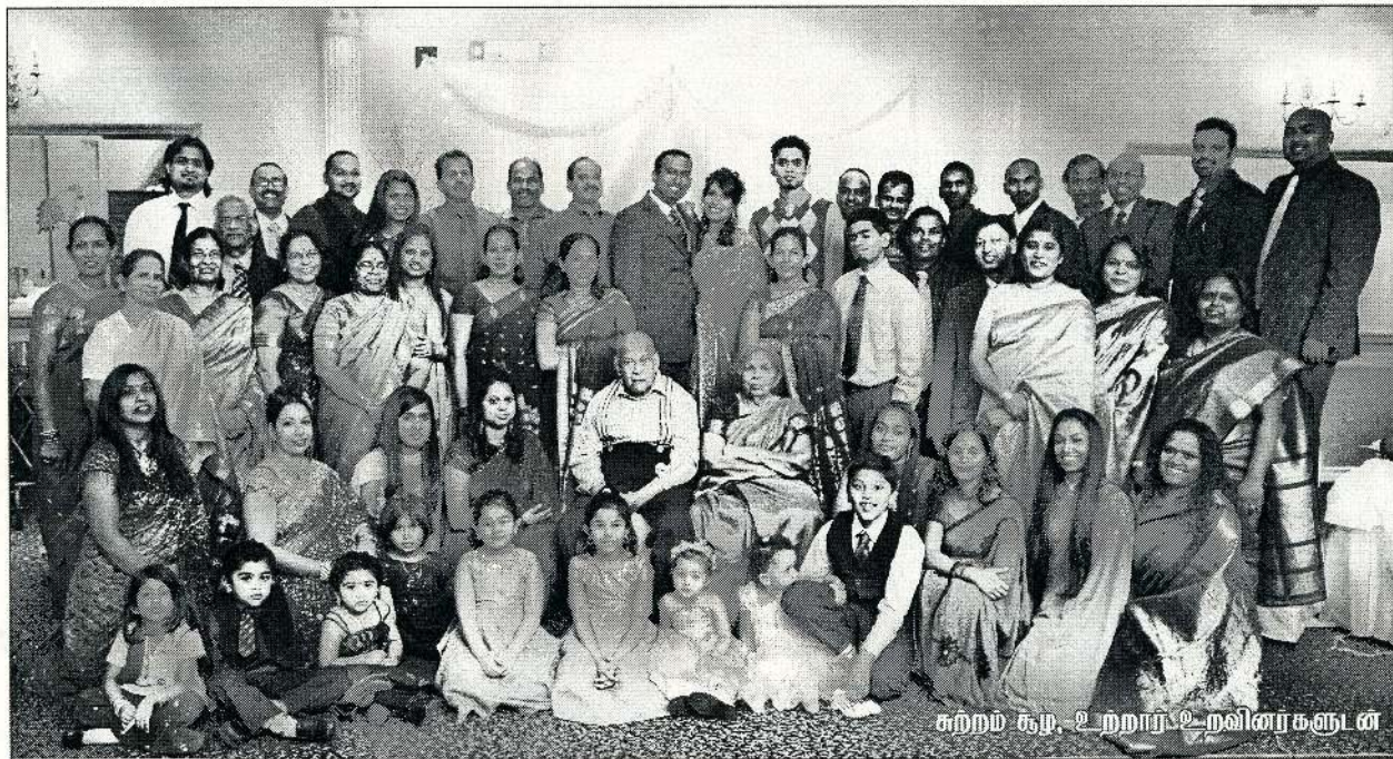
சுற்றம் சூழ, உறறாய் உறவினர்களுடன்