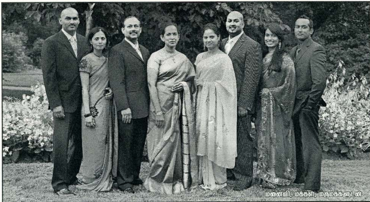
மனைவி, மக்கள், மருமகனாள்