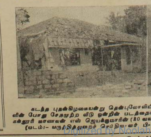
கடந்த புதன்கிழமைக்கு தென்புலாவில் அரசு படைகள் நடத்திய பொய்க்கை தாக்குதலில் பலியான அப்பணியைச் சேர்ந்த ஒருவரின் உடலை காட்டுகிறது.