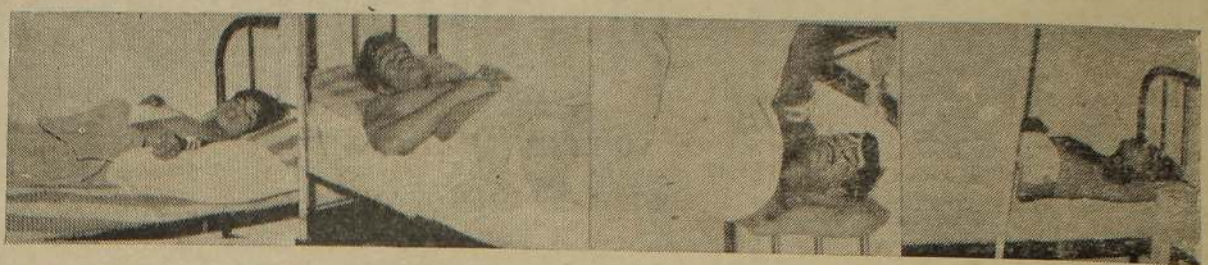
ஞாயிற்றுக்கிழமை சம்பவத்தில் படுகாயமுற்று யாழ்ப்பாணம் ஆஸ்பத்திரியில் அனுமதிக்கப்பட்டிருந்தவர்களில் சிலரைப் படத்தில் காணலாம்.

நேற்றும் இரத்ததானம் யாழ்ப்பாணம், ஜன. 7 யாழ்ப்பாணம் ஆஸ்பத்திரியில் நேற்றும் இரத்ததானம் செய்யப்பட்டது. பொதுமக்கள் தாமா கலை முன்வந்து இரத்த தானம் செய்தனர். 25 பைந்து ரத்தம் தானம் செய்யப்பட்டது. நேற்று முன்தினம் பொதுமக்கள் 35 பைந்து இரத்தம் தானம் செய்து தெரிந்ததே.