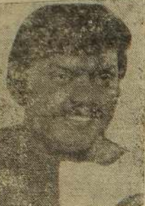
விஜய்காந்த் அண்ணன்-தம்பி சண்டை போன்றது சகோதரர்கள் ஏன்சண்டை போட வேண்டுமென்பது எனக்குப் புரியவில்லை. யார் மீது தப்பு, யார் சரியானவர்கள் என்பதை நான் கூறமுடியாது. ஆனால் தமிழர்களை சமீப காலங்களில் எப்படியாவது நிறுத்தப்படவேண்டும். நமக்குள் சொந்தத்திற்குள்

சென்னை விருந்து எழுந்த அலுவலகச் சிறப்புப் பிரதிபிதி: ந.வித்தியானை —மோதல் நடக்கக் கூடாது இந்த சமாதானப் படை அண்ணன் போன்ற அடிகள் பெருமனது வைத்து பின்வாங்கிவை நடவடிக்கை செய்தால் மோதல் நிற்கும். மக்கள் குழப்பம் இந்த இராணுவ நடவடிக்கைக்கு பின்னணியாக இருக்க அரசியல் நோக்கம் என்ன என்பது எமக்குப் புரியவில்லை. கொல்காத்திச் செய்தி ஒன்று கூறுகிறது. திருநெல்வேலி வேறு ஒரு விதமாகக் கூறுகின்றன. அரசியல் வாதிடும் மற்றொரு விதமாகக் கூறுகிறார்கள். மக்கள் ஒன்றும் புரியாமல் மழம்பி போய் நிற்கிறார்கள். நான் இங்குள்ளதான்; ஆனால் தமிழன் என்று கூறுவதில் தான் பெருமைப்படுகின்றேன். தமிழன் என்ற முறையில் எனது தனிப்பட்ட உணர்வுகளை வெளி காட்டத் தவறாட்டேன். சமீபத்தில் நான் தமிழ்நாட்டுக்குத் தமிழர் சனநாயகத்தை, மதத்தினால் வேறுபாட்டிற்குக் கிடையாது என்று சொல்லும் ஆனால் நான் எல்லாம் மொழியால் என்று தப்பிட்டுக்கொண்டு உணர்வுகள் ஒன்றுபட்ட