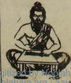
குறள். இன்பம் விழையான் இடுமபை இயல்பென்பா... தன்பம் உறுதல் இவன்.

அந்தக் குழந்தையைக் கையில் அழை ஏந்தியவரின் உணர்வு தீர்க்கும்படி நினைவில் வைத்துக் கொள்ளும்படி உணர்ச்சி வசப்பட்டு நியமிக்க இருக்கின்றன இப்படிச் சட்டமேற்படுத்தப்பட்டார். (9-8)