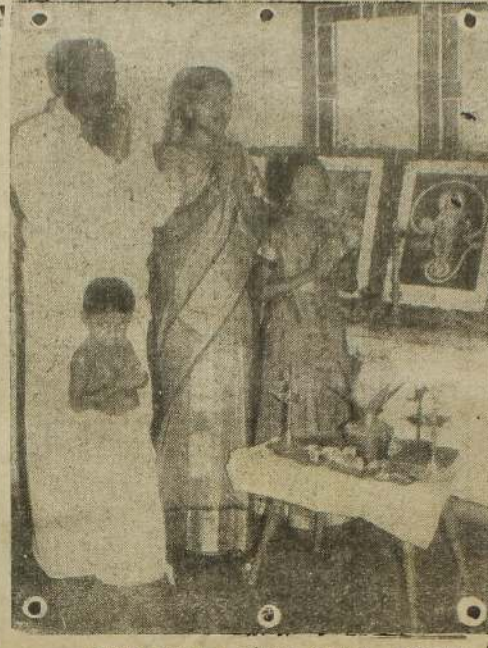
ஆற்று மலநா விபவ ஆணை உணமை களைப் போக்கி இன்பம் தரவும், வளம் பெருக்கி நலம் பொலியவும், அன்பும், பண்பும், சமாதானமும், சாத்தியும், அமைதியும், அறமும் நீதியும் நிலைத்திடவும் வழி செய்திட வேண்டுமென்று இவ்வகையின இறைஞ்சுகின்றனர் இ. குறி பத்தினர். நன்னுடன இச்சித்திரைப் புத்தாண்டில் தமிழர் இல்லந்தோறும் இந்தக் காட்சியைக் காணலாம். (அ)

அதிகள் புனர்வாழ்வுப் பணியும், புனர்நிர்மாணப்பணியும், சமகாலத்தில் மேற்கொள்ளப்படும், அவை மிக விரைவில் ஆரம்பிக்கப்பட்டுவிடும். இவ்வாறு ஐக்கிய நாடுகள் சபையின் புனர்வாழ்வு உயர் ஸ்தரானி கர் குழுவின் திட்ட அலுவலர் திரு. லாமியன் நேரடியானுக்குத் தெரிவித்தார். இந்தியாவிலிருந்து தமிழகத்திலிருந்து கடந்த வாரம் அதிகர்கள் யாழ்ப்பாணம் வந்ததைத் தொடர்ந்து, ஐ.நா. அதிகர்கள் புனர்வாழ்வுக் குழு ஒன்று இங்கு வந்திருப்பது தெரிந்ததே. இந்தக் குழுவில் இலங்கையின் ஓர் உயர் உட்பட ஐவர் அங்கம் வகிக்கின்றனர். பிரஸ்தாப குழு தனது புனர்வாழ்வு புனர்நிர்மாணப் பணிகளை முடியும் வரை இங்கு வதிவிட அலுவலகம் ஒன்றை அமைத்துத் தனது திட்டங்களை மேல் நடத்தும் குழுவின் திட்ட அலுவலர் திரு. லாமியன் குழுவின் புனர்வாழ்வு புனர்நிர்மாணத் திட்டங்களை உதயன் செய்தியாளர்களிடம் வினாக்களை அவர் தெரிவித்தார். நாட்டு நிலையை அவதானித்த பின்னர், புனர்நிர்மாண புனர்வாழ்வு வேலைகளை உடன் மேற்கொள்ள நடவடிக்கை எடுத்துள்ளோம். ஐ.நா.வின் புனர்வாழ்வு, புனர்நிர்மாண வேலைகள் குறித்துப்போது