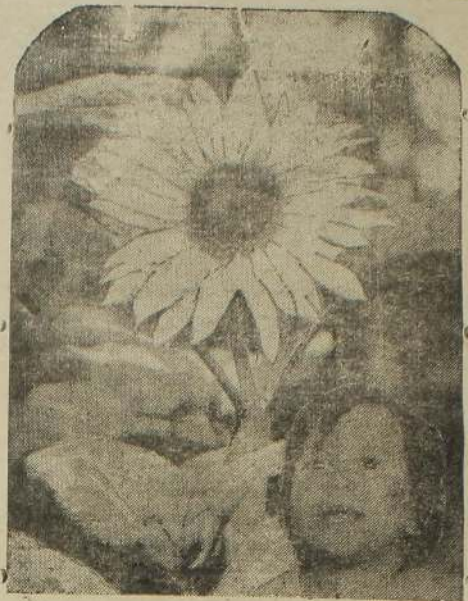
மலரும் மகிழ்ச்சியும் மலர்ந்து பொலியும் சித்திரைப் புத்தாண்டை சிரித்து வரவேற்கும் வெள்ளை உடைமம் கொண்ட சின்னஞ் சிறுவனைப் பாருங்கள்.