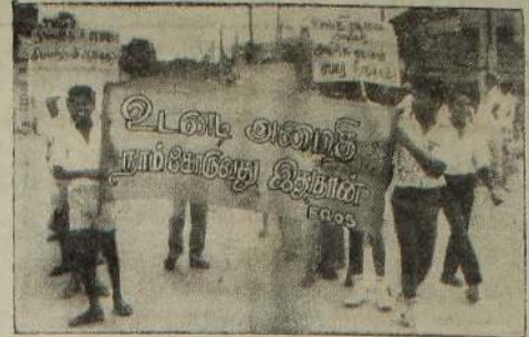
கடந்த திங்கட்கிழமை கன்னகத்தில் ரிசோஸ் இயக்கத்தினர் ஒழுங்கு செய்திருந்த ஊர்வலத்தில் சுலோகக்கொடிகள் கொண்டு செல்லப்படுவதை படத்தி

★ மற்றும் சகல விபரங்களுக்கும் உடனடியாகத் தொடர்பு கொள்ளுங்கள். எஸ். பி. அன்ரன் வேல் ரேட் சென்டர் [மக்ள் வங்கி முகாரச்] இல. 114, ஸ்ரான்லி வீதி யாழ்ப்பாணம். (C-5399)