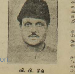
வி. பி. சிங்

கடைசியில் நான்கு மணி அடித்து நான்கு நிமிடங்களானதும் மன்னர் உயிர்பிரிந்தது.