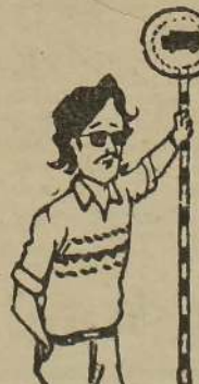
எங்கடைய ஆட்களா ஏறின விளை குறைந்தா தாங்களும் குறைப்பினம். அதுதான் எங்கடைய அசாதாரண நடைமுறைகள். சந்திரப்பயம் பார்த்துக் கட்டுகின்றோம் தவிர ஒரு போதும் குறைக்கமாட்டோம்!

லண்டன், பெப். 18 ஈழத் தமிழர் அகதிகளை நாடு கடத்தும் முடிவுக்கு லண்டன் மேல் நீதிமன்றம் இடைக்காலத்தடை உத்தரவுக்கு எதிராக நீதிமன்றத்தில் மேல்முறையீடு செய்யப்படும். இதற்கான அவசர நடவடிக்கைகளை பிரிட்டிஷ் உத்தரவு அமைச்சர் எடுத்து வருகிறது. (இ-10)