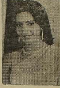
தாக்குதலுக்குப் பின்னர் நதியாவுடன் சமீபத்தில் சந்திப்பு செய்துள்ளார் நதியா.

நடிகர் ரகுமானுக்கும் நதியாவுக்கும் இடையில் காதல் உண்மையா? அப்படி ஒன்றும் இல்லை என்று கூறுகிறார் நதியா. பத்திரிகை ஒன்றிற்கு அளித்த பேட்டி ஒன்றில் இது குறித்து சமீபம் கமல் முத்தகாட்சி பற்றி வருடங்களுக்கு முன்பே 'வன மோகன்' படத்தில் வந்திருந்தார். முத்தகாட்சியை அப்படியே மோகன் படத்தில் படுத்த தேவையில்லை என்பதையும் சொல்லியிருக்கிறார். பின்னர் உள்வாங்கி வந்தார். இவ்வாறு கமல் கருவிகள் மோகன் என்ற ஒரு அணுவும் ஒரு பெண்ணை முத்தமிடுவதை விடும்படியான ஒரு இடம் மாட்டான். நானும் அப்படியே. இதை மறு பவன் வேஷம் தரிப்பதே இப்போது தரப்போடுகிறார்கள். அதை இது தமீழ்ப் பன்