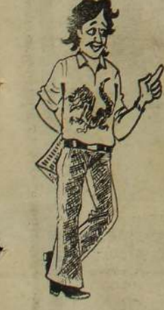
உவர் காணிக்காரர் நான்கூர், வாழைத் தோட்டக் காரருக்கு இன்டல் விடுகிறார் போலீஸ்.....!

அப்போதுதான் ஜனநாயக இனத்தெரிவித்தனர் (8-ஆம் பக்கம் பார்க்க)