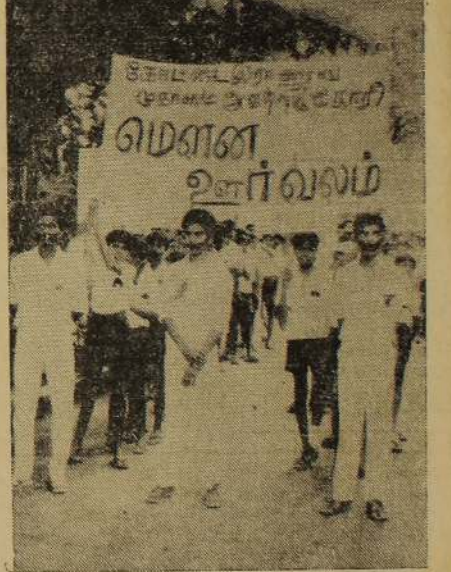
நேற்று நடைபெற்ற மெளன ஊர்வலத்தின் போது எடுக்கப்பட்ட படம்.

யாழ்ப்பாணம், நவ. 7 பருத்தித்துறை கடல் பகுதியில் மீன்பிடிக்கும் மீனவர்களை துன்புறுத்தும் நோக்குடன் கடல் மரங்களில் சென்ற சிப்பாய்களை நோக்கி தமிழீழ விடுதலைப் புலிகள் 'கிளைப்பர்' தாக்குதல் நடத்தினர். இதன் காரணமாக ஒரு சிப்பாய் பலியானதாக புலிகள் தரப்பில் தெரிவிக்கப்பட்டுள்ளது. நேற்றுப் பிற்பகல் நான்குமணி அளவில் பருத்தித்துறை முனைப் பகுதியில் இச் சம்பவம் நடைபெற்றது. புலிகளின் தாக்குதலுக்கு ஈடுகொடுக்க முடியாத சிப்பாய்கள் இறந்தவரின் சடலத்தையும் எடுத்துக் கொண்டு முகாம் திரும்பினர். பின்னர் அங்கிருந்து மோட்டோ ஷேல் தாக்குதல் மேற்கொண்ட (4ஆம் பக்கம் பார்க்க)