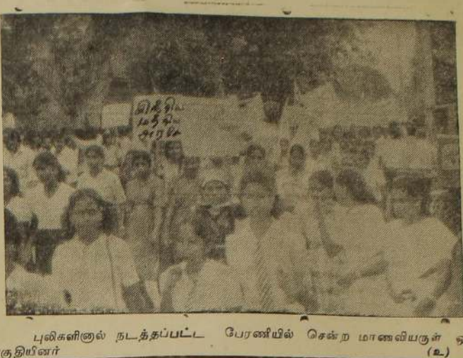
புலிகளினால் நடத்தப்பட்ட பேரணியில் சென்ற மாணவியருள் ஒரு பகுதியினர் (உ)