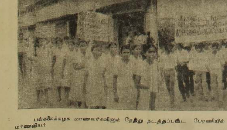
பல்கலைக்கழக மாணவர்களினால் நேற்று நடத்தப்பட்ட பேரணியில் சென்ற மாணவ, மாணவியர் (உ)

மேற்படி வங்கியின் அலுவல்கள் யாவும் 25-11-1986 செவ்வாய்க்கிழமை முதல் பாதுகாப்புக் காரணங்களை முன்னிட்டு ஸ்ரான்லி வீதி, இல. 54 இல் அமைந்துள்ள (ஆரியகுளம் சந்தியிலிருந்து சுமார் 150 யார்க்கு தொலைவில், ஸ்ரீதர் சினிமாவுக்கு அண்மையில்) தற்காலிக அலுவலகத்தில் நடைபெறும். ஆஸ்பத்திரி விதியிலுள்ள தற்போதைய அலுவலகம் தற்காலிகமாக மூடப்பட்டுள்ளது. வாடிக்கையாளர் அனைவரும் புதிய அலுவலகத்திற்கு வருமாறு அன்புடன் வேண்டப்படுகின்றனர். தற்காலிக தொலைபேசி இல. 23175