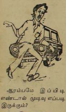
ஆரம்பமே இப்பிடி எண்டால் முடிவு எப்படி இருக்கும்?

இந்திய படகுகளுக்கு என்ன நடக்கும்? கொழும்பு, ஜூன் 3 ஸ்ரீலங்கா அரசின் உணவுப் பொருள்களுடன் வரும் இந்தியப் படகுகளுக்கு ஆயுதநிலைய யிலான எதிர்ப்பைக் காட்டும் சாத்தியம் இல்லை. — இப்படி கொழும்பில் வெளிநாட்டமைச்சுப் பேச்சாளர் ஒருவர் செய்தியாளர் மத்தியில் தெரிவித்தார். (இ-எ)