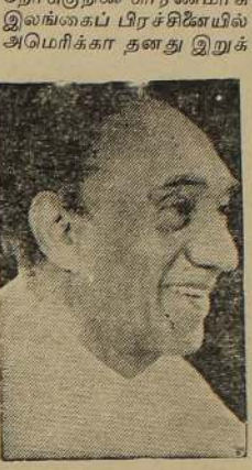
கமரான போக்கைத் தளர்த்தியது.