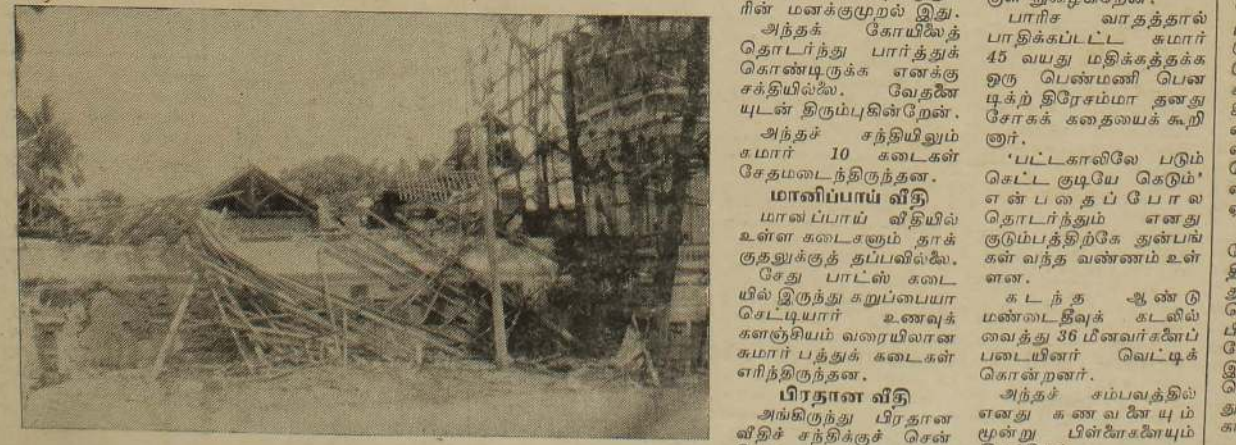
வண்ணை வைத்தீஸ்வர ஆலய இடிபாடுகள்