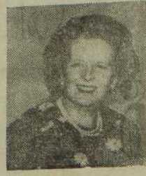
மார்கரெட் தட்சர் ஒரு சபாநாயகம் மூன்று பிரதிகள் சபாநாயகர் களும் நாளுக்கு தொகுதிகளைப் பிரதி

பிரிட்டிஷ் பொதுத் தேர்தலில் திரும்பித் தேர்ச்சி செய்யக் கூடியவர்களைக் கட்டி 100க்கு மேற்பட்ட பெரும்பான்மை ஆசனங்களை மீண்டும் அமோக வெற்றியீட்டி உள்ளது. 1964 ஆம், 74 ஆம் ஆண்டு தேர்தல்களில் பிரிட்டனின் தொழிற் கட்சிப் பிரதமர் ஹரோல்ட் விட்சன் போன்ற சிறிய பெரும் பான்மையுடனேயே திருமதி தட்சர் மீண்டும் பதவிக்கு வருவார் என்ற அரசியல் ஊகங்கள் எல்லாம் தவிர பொடியாகி விட்டன. இரும்புச் சீமட்டியின் இரும்புக் கொள்கைக்குக் கிடையாத வெற்றி இது என்று அவதானிகள் பலரும் கருத்துத் தெரிவிக்கின்றனர். 61 வயது நிரம்பிய திருமதி தட்சர் இந்த வெற்றி மூலம் இன்னும் 5 வருடகாலத்துக்கு பிரிட்டிஷ் பிரதமராகப் பதவி வகிப்பார். தொடர்ந்து மூன்று பொதுத் தேர்தல்களில் வெற்றி பெற்றது மூலம் நூற்றாண்டுச் சாதனை ஒன்றை அவர் நிலை நாட்டி உள்ளார். இந்த வெற்றி க்ஷேத்ர வேட்டில் கட்டிவைக்க கிடையாத வெற்றி என்று கூறுவதைத் திருமதி தட்சர் தப்பிவிட்டாள். செல்வாக்குக்குக் கிடையாத வெற்றி என்றே கூறலாம். பிரிட்டனின் புதிய நாடாளுமன்றம் அதாவது காமன்சைப் எதிர்வரும் 17 ஆம் திகதி கூடிய புதிய சபாநாயகரைத் தேர்ந்தெடுக்க வேண்டும் என்று அறிவிக்கப்பட்டுள்ளது. அச்சுவேலிச் சந்தியில் உள்ள ஒரு கடைசியில் தேர்தல்களைக் கண்டித்துக் கொண்டுள்ளவர்கள் தங்கியிருக்கிறார்கள். இவர்கள் தங்கியிருக்கிறார்கள். இவர்கள் தங்கியிருக்கிறார்கள்.