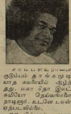
சாயிபாபா தாய சேவைக்கு அளித்த அரும் பெரும் பரிசு