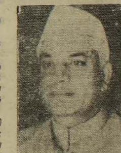
திவாரி யாது; நாடவம் கூடாது- இப்படி அமைச்சர் திவாரி மேலும் தெரிவித்தார். (இ-எ)

உதவிக்கு வந்த சிப்பாயும் பலி! யாழ்ப்பாணம், ஜூன் 14 பொலன்னறுவை மாவட்டத்தில் உள்ள கொடப்பத்த என்ற குடியேற்றக் கிராமத்தில் எட்டுப்பேர் சுட்டுக் கொல்லப்பட்டனர் என்று அரசு அறிவித்துள்ளது. இவர்களில் இரு பெண்களும் ஒரு குழந்தை ஆடங்கி உள்ளனர். இச் சம்பவத்தை அடுத்து அங்கு விரைந்த சிப்பாய்களிலும் ஒருவர் சுட்டுக் கொல்லப்பட்டார் என்று அறிவிக்கப்படுகிறது. வெள்ளிக்கிழமை இச் சம்பவம் நடந்தது. (இ)