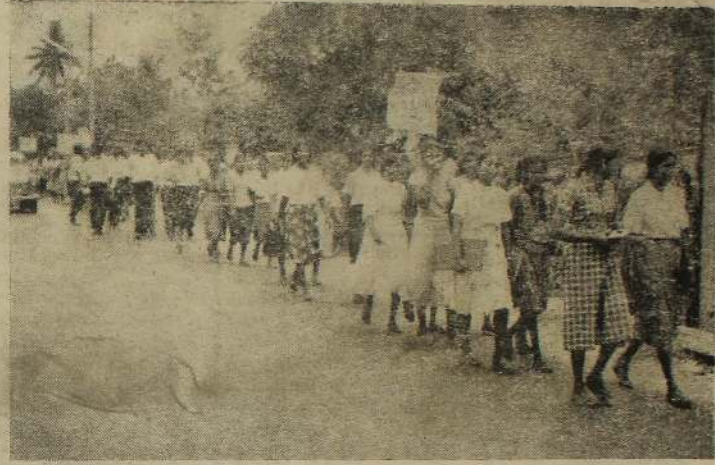
யாழ்ப்பாணம் பல்கலைக்கழக மாணவர்கள் திங்கட்கிழமை நடத்திய பேரணியின்போது எடுக்கப்பட்ட படம்.

தொலைபேசிப் பிரச்சினை போரிய தொலை யாமி போச்சுது பாத்தியுளோ...! என்டாலும் ஹெக்டே கனவான் தனமய ரஜினிமாச் செய்து விட்டார்! எங்கு கடை நாட்டிலே என்டால்...?!